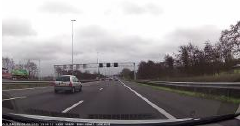
Figuur 2: camerabeeld van verkeerssituatie voor de auto

Na het rijden van de route werden de deelnemers geïnterviewd over hun rijgedrag. Het interview bestond uit twee delen: een deel met vaste vragen over het rijgedrag van de deelnemer in het algemeen en een deel waarbij aan de hand van de camerabeelden het rijgedrag en motieven daarachter werden besproken. Tijdens het interview werden de vier strategieën uitgelegd en besproken aan de deelnemers.