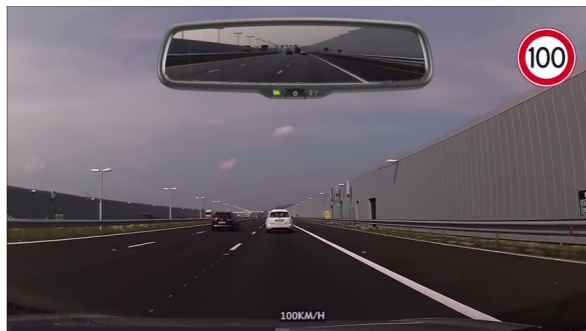
Figuur 3: voorbeeld filmpje ( https://www.youtube.com/watch?v=1mwKM7IVIBo )